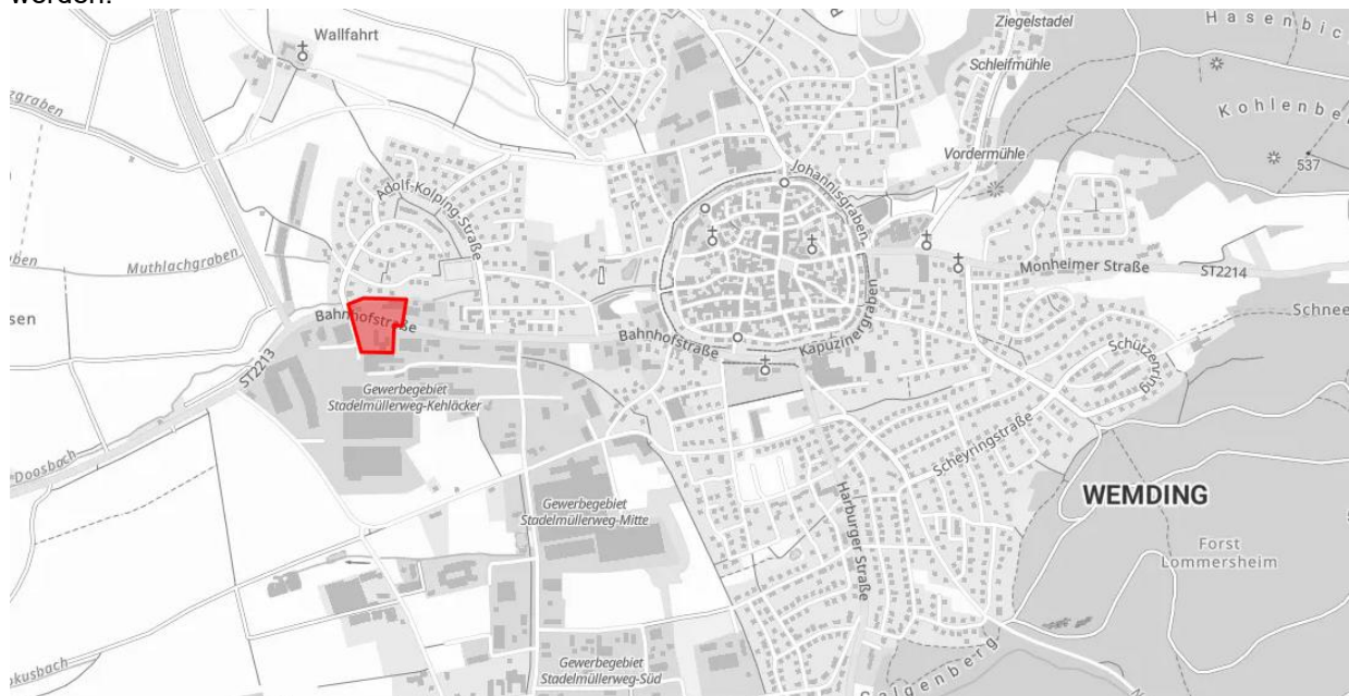
Abb. 1: Lage im Raum, ohne Maßstab

Das Plangebiet befindet sich nördlich und südlich der Bahnhofstraße in einem Gewerbegebiet am westlichen Ortsrand von Wemding. Das Gelände kann aufgrund der geringen Neigung als eben bezeichnet werden.